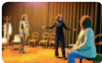
Assaig de l'obra