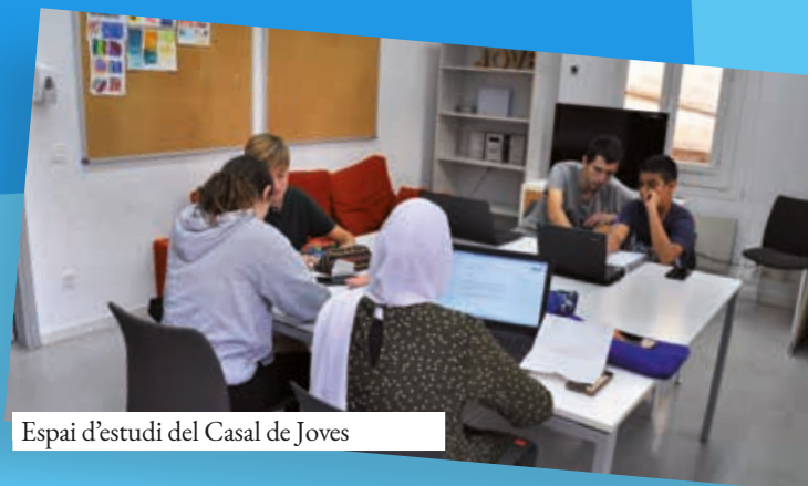
Espai d'estudi del Casal de Joves

Una recent reforma ha dotat l'equipament d'espais diàfans adequats a les necessitats actuals. A més del consolidat servei Kftí, el Casal disposa de l'Espai Kftó.