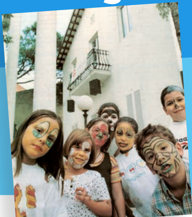
Els primers usuaris del Casal de Joves ja tenen 35 anys

El Casal de Joves de Ripollet compleix 25 anys des de la remodelació de 1997, que va fer que l'edifici esdevingués l'actual Casal, a més d'acollir la ràdio. El model inicial, enfocat a la informació juvenil, ha evolucionat amb un gir educatiu i d'acompanyament del jovent. En els primers anys, el Punt d'Informació Juvenil (PIJ) va esdevenir una peça clau per ajudar a les persones joves a aconseguir la seva autonomia, emancipació i exercici de la plena ciutadania, mitjançant l'accés a la informació i una primera atenció municipal. El 2005 va suposar l'arribada del servei Kftí, un espai educatiu no formal per a joves de 12 a 17 anys i que promou la socialització activa i positiva de les persones joves.