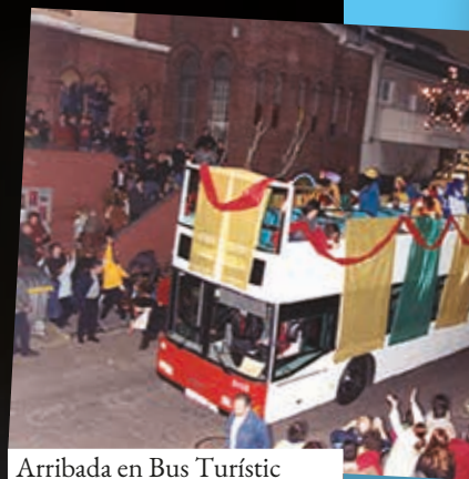
Arribada en Bus Turístic

Després de 54 anys, ses Majestats els Reis Mags d'Orient les han vist de tots colors quan han visitat Ripollet per celebrar la tradicional Cavalcada de Reis. Van conèixer el poble en plena dictadura, i van veure com arribava la democràcia. Amb els anys, van conèixer les reivindicacions veïnals, van veure com el segle XX deixava pas al segle XXI i van patir amb la resta de veïns i veïnes de Ripollet la gran crisi econòmica mundial de l'any 2008. Ja només faltava que l'any 2020 arribés un virus nou i confinsés tot el món durant uns mesos. Les restriccions sanitàries van obligar a repensar la Cavalcada i convertir-la en un Campament Reial. Després de dos anys des de la pandèmia de la COVID-19, aquest any sí els Reis Mags tornaran a voltar per Ripollet, fent honor al lema de la Cavalcada de Reis d'aquest 2022: "La Màgia torna al carrer".