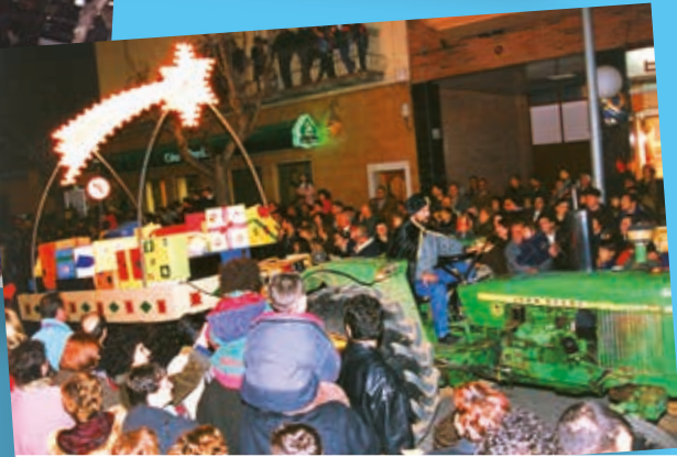
La Carrossa de l'Estel va obrir molts anys la Cavalcada (1995)

d'un centenar de ripolletencs i ripolletenques vinculats al teixit associatiu de la ciutat. D'aquesta manera, l'entitat Ripollet Costums i Tradicions vol aconseguir una celebració més democràtica i arrelada a la vila.