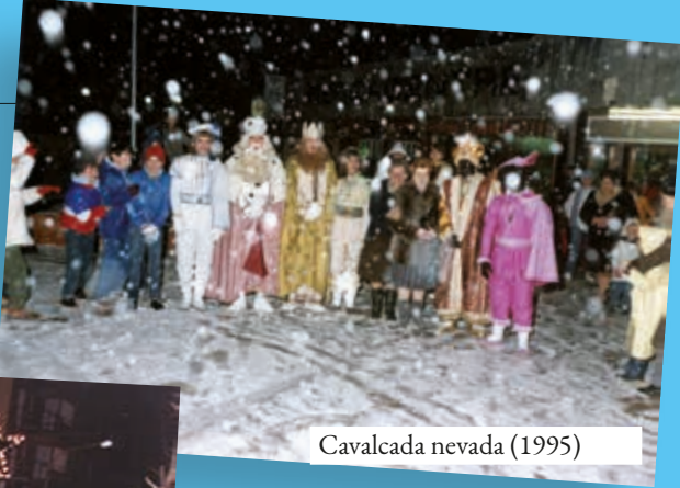
Cavalcada nevada (1995)