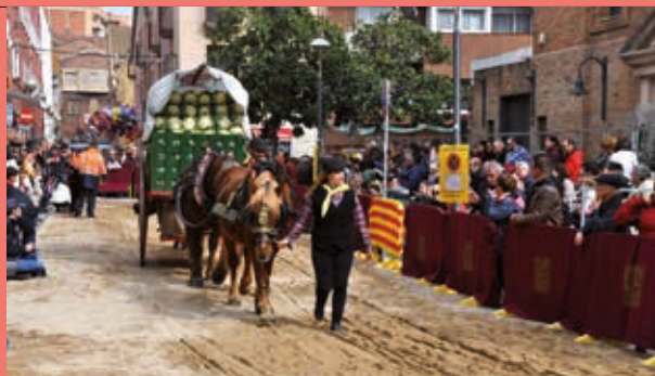
Tres Tombs de l'any 2020, a la pl. de l'Onze de Setembre

Més de 6.000 alumnes d'11 centres educatius de Ripollet participaran aquest any a la campanya escolar de teatre, música i dansa, en la qual l'Ajuntament ofereix a les escoles i instituts la possibilitat de gaudir d'un espectacle durant l'horari lectiu al Teatre Auditori. La campanya s'ofereix als centres escolars i, des de fa dos anys, també a alumnes de 1r d'ESO. Al gener es van programar espectacles de música, amb la participació de 9 escoles i 2.230 infants. El pròxim març tocarà obres de teatre i maig estarà dedicat a la dansa.