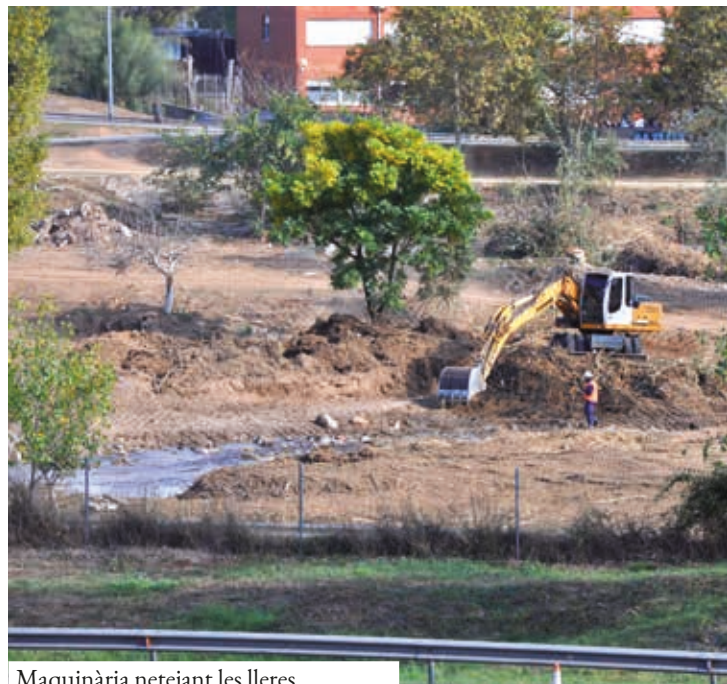
Maquinària netejant les lleres