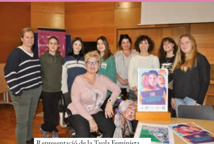
Representació de la Taula Feminista