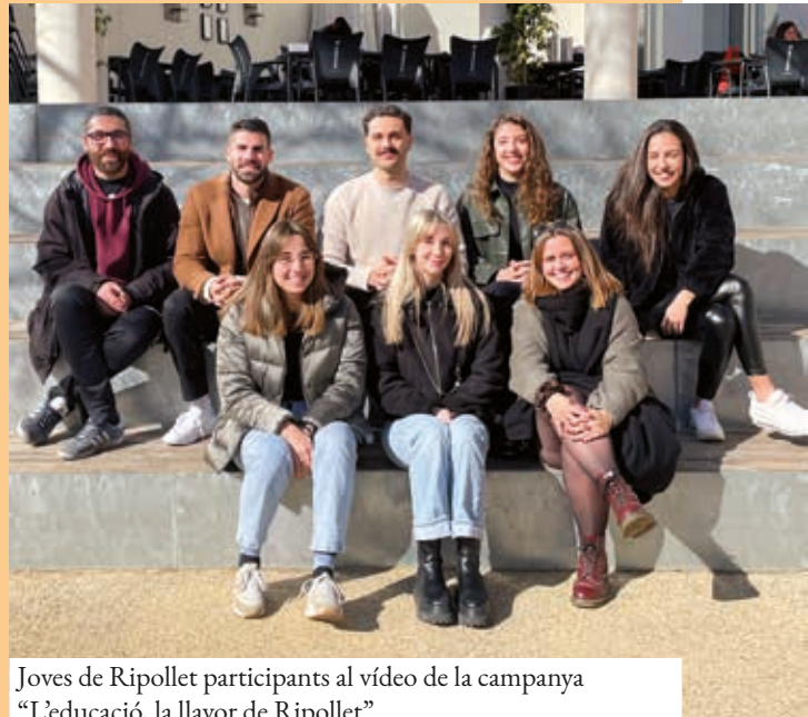
Joves de Ripollet participants al vídeo de la campanya "L'educació, la llavor de Ripollet"

Amb l'objectiu de potenciar la formació del municipi més enllà de l'ESO, el pròxim 24 de març s'organitzarà la primera mostra d'educació postobligatòria, amb la col·laboració dels centres de secundària que ofereixen batxillerat i cicles formatius; el Servei Local d'Ocupació de Ripollet Impulsa; el Casal de Joves; el Centre de Normalització Lingüística i l'Escola de Persones Adultes Jaume Tuset. Al matí, els alumnes dels centres educatius podran visitar la mostra i, durant la tarda, ho podran fer les famílies. D'altra banda, els instituts públics també han organitzat les portes obertes de postobligatòria, del 29 de març al 17 de maig.