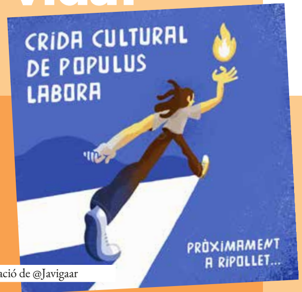
Il·lustració de @Javigaar

Hem convertit les cures bàsiques i la salut integral en l'enfocament de les jornades de la crida cultural. Divendres a la tarda, la temàtica serà "Salut, Benestar i