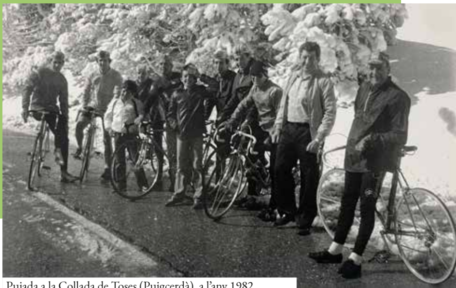
Pujada a la Collada de Toses (Puigcerdà), a l'any 1982

L'any 2005 es crea el grup de BTT, que en l'actualitat disposa de 2 grups. També s'atreveixen amb les "brevet" o "randonées", circuits de llarga distància