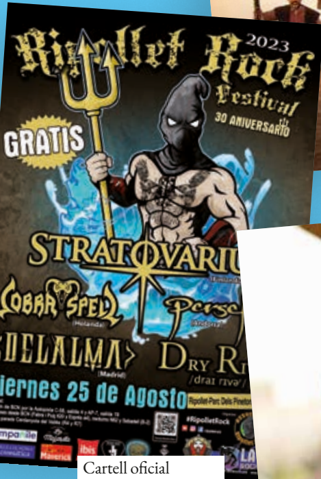
Cartell oficial del Festival Ripollet Rock