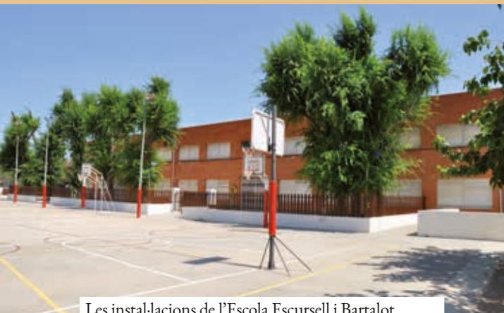
Les instal·lacions de l'Escola Escursell i Bartalot són un dels seus principals actius