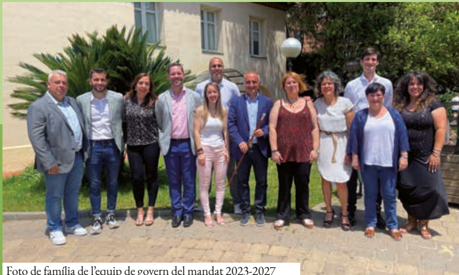
Foto de família de l'equip de govern del mandat 2023-2027

alcalde que ha sortit a patrullar en primera línia amb ells i he après molt i estic molt orgullós de la nostra Policia Local. Som una ciutat tranquil·la, però hi ha molta feina a fer.