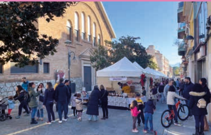
El Mercat de Nadal tornarà a la plaça de l'Onze de Setembre