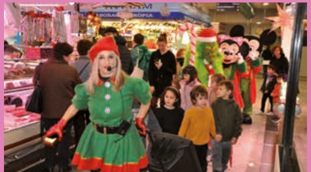
Animació per a grans i petits al Mercat Municipal

El programa de Nadal d'enguany compta amb una trentena d'activitats i diverses novetats, tant comercials com culturals, on no faltaran la música, el teatre, la gastronomia típica d'aquesta època, els actes de la Marató de TV3, ni els pessebres, que enguany celebren els seus 800 anys d'història.