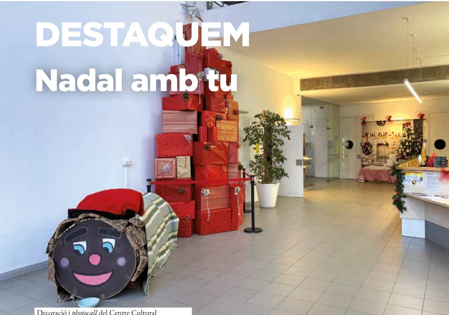
Decoració i photocall del Centre Cultural