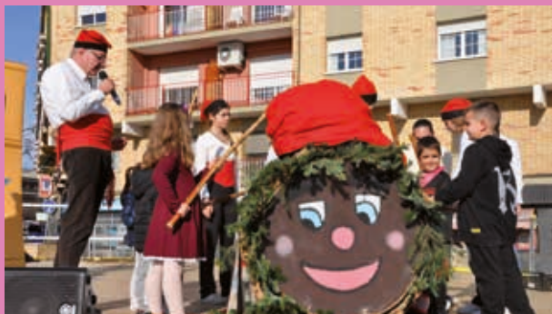
El Tió de Nadal, la cantada de nades, el Quinto de Diables i la tradicional mostra de pessebres tornen a ser protagonistes