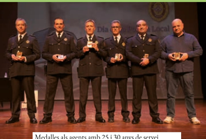
Medalles als agents amb 25 i 30 anys de servei