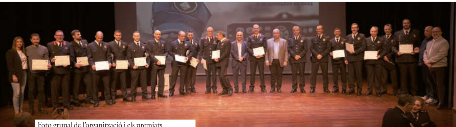
Foto grupal de l'organització i els premiats