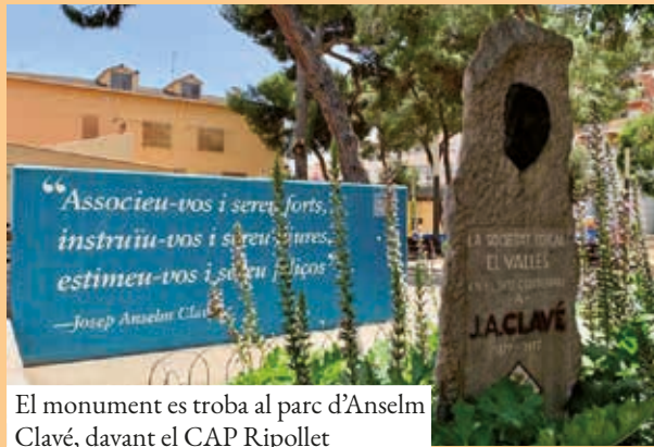
El monument es troba al parc d'Anselm Clavé, davant el CAP Ripollet

Ripollet és una vila molt lligada amb Anselm Clavé a través de les entitats, però també perquè sota el seu nom hi conflueixen espais naturals, de l'entramat urbà i de l'educació. Qui no ha anat al parc abans conegut com a "Parc del Senyor José", coneix algú que viu al carrer d'Anselm Clavé o ha estudiat a l'escola pública que duu el seu nom?