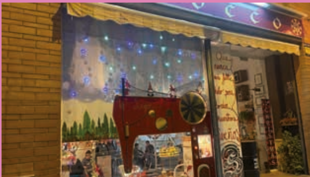
Sirocco va ser el guanyador del Concurs d'Aparadors l'any 2022