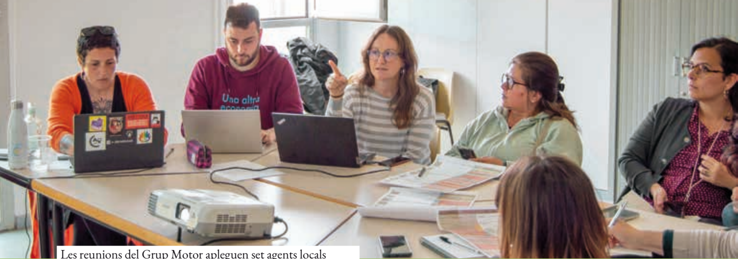
Les reunions del Grup Motor apleguen set agents locals

La comunalitat urbana de Ripollet Populus Labora és una iniciativa impulsada per entitats ripolletenques i l'Ajuntament de Ripollet, amb el suport de la Generalitat, que treballen plegades per l'enxarxament de tot el teixit del municipi i per canviar la realitat socioeconòmica del nostre territori, obertes a la participació dels agents locals que s'hi vulguin vincular. Després d'una primera etapa de dos anys, ha estat renovada per dos anys més, amb una subvenció de 175.000 € per any, per a executar un total de 70 accions anuals per a la població.