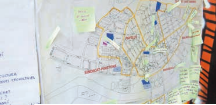
Al plànol de la ciutat es situen els projectes vinculats a la creació