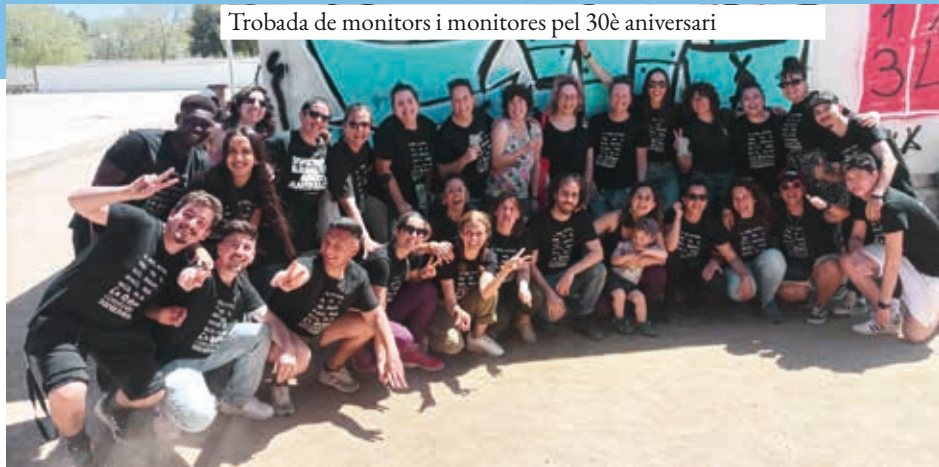
Trobada de monitors i monitores pel 30è aniversari

Així doncs, fem que aquestes hores perdudes d'aprenentatge siguin cada vegada més reduïdes, fem que l'esclatxa no sigui visible a l'ull, fem que l'equitat educativa no sigui un repte sinó una realitat. Fem 30 anys més de Gresca!