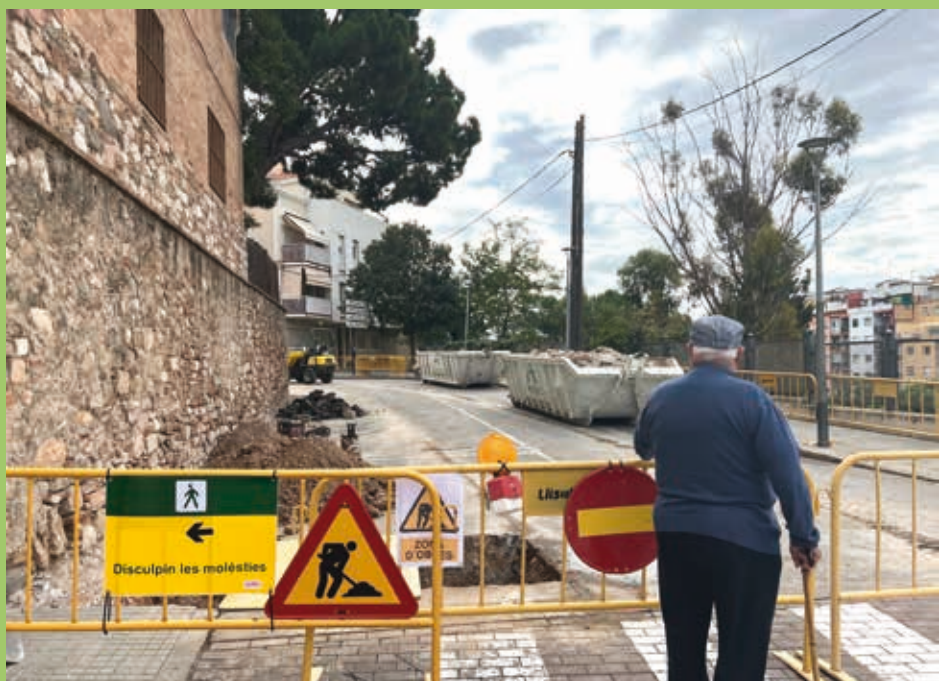
L'ampliació de les voreres al c. Padró, una millora per als veïns i veïnes que hi transiten

A la tornada de les vacances s'han iniciat diverses obres d'ampliació i millora de voreres, asfaltat, reorganització de zones d'aparcament i de carrils bici. En aquest procés per reparar i modernitzar els carrers de Ripollet, hi ha obres que ja estan en marxa, com ara l'ampliació de les voreres el carrer Padró, des d'Isabel la Catòlica fins al carrer del Calvari, i el canvi de sentit de la circulació del mateix carrer del Calvari, amb un pressupost d'execució de 128.334 €. Aquest projecte permetrà, un cop acabat, una millor sortida del nucli antic de Ripollet i un carrer Padró més accessible i inclusiu.