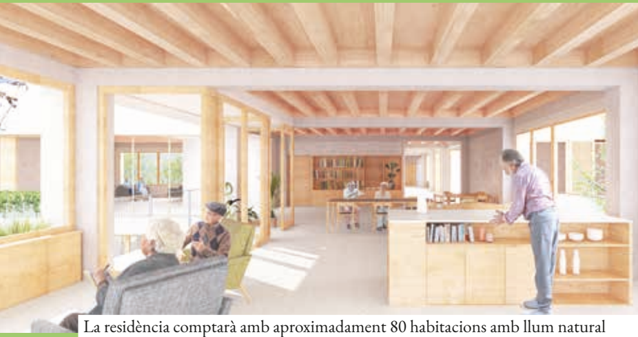
La residència comptarà amb aproximadament 80 habitacions amb llum natural

compromís de millorar la qualitat de vida de la gent gran, garantint que tinguin l'atenció, l'acompanyament i els serveis que mereixen en un entorn modern, accessible i segur", va afirmar Tirado.